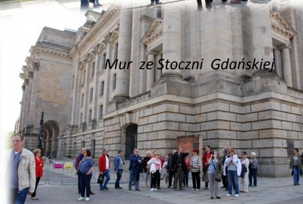
Mur ze Stoczni Gdańskiej