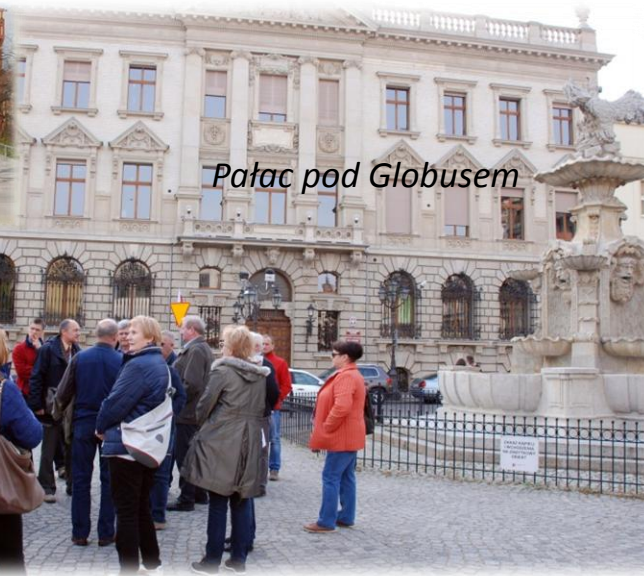
Pałac pod Globusem