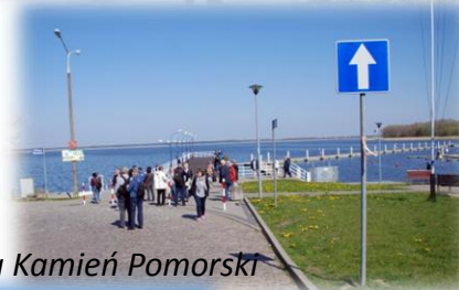
Port Jachtowy Marina Kamień Pomorski